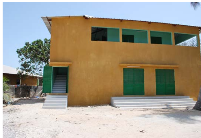
Collège de Diembering : nouveau bâtiment dont le 1 er étage sera dédié à la salle informatique