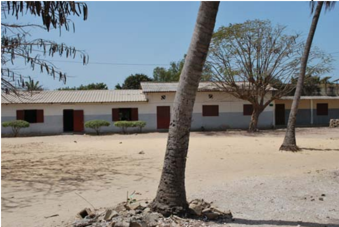
La cour du Collège de Diembering

Inform'Africa souhaite réaliser son premier projet en installant 14 ordinateurs reliés en réseau, dont 12 ordinateurs dans une première salle accessibles aux élèves et 2 autres dans la salle des professeurs.