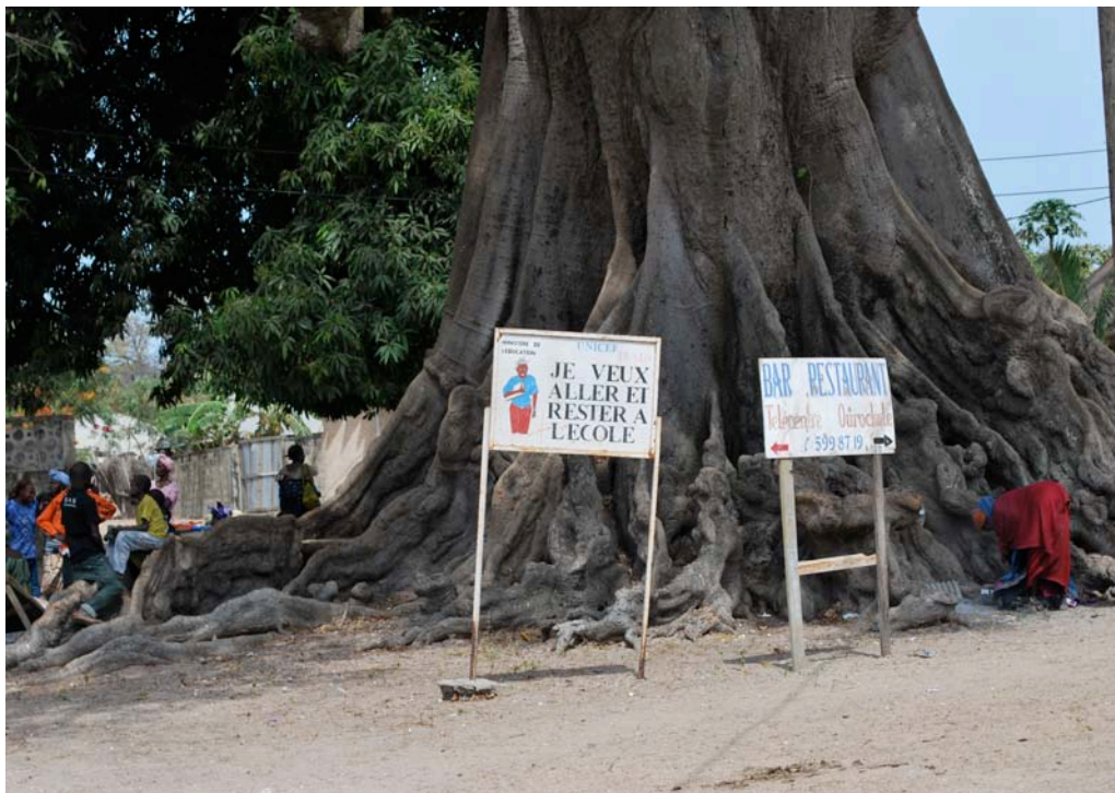
Arbre « Fromager » âgé de 400 ans à l'entrée du village en face du collège