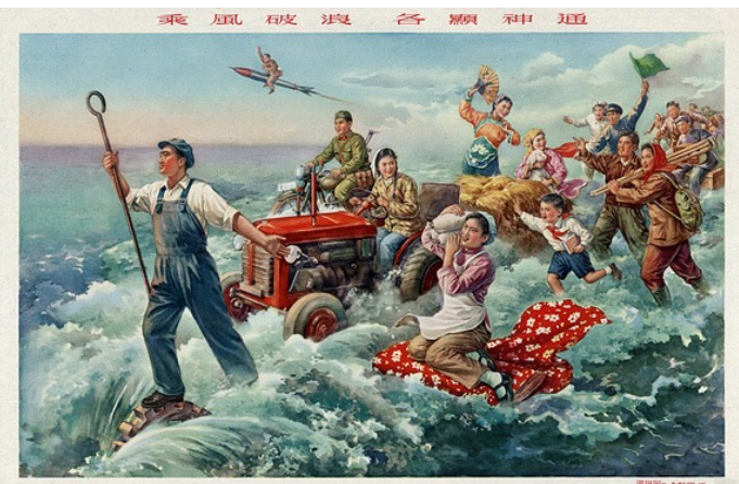
Affiche de propagande du Grand bond en avant: ouvriers comme paysans semblent portés par les flots, alors qu'un militaire chevauche une fusée.