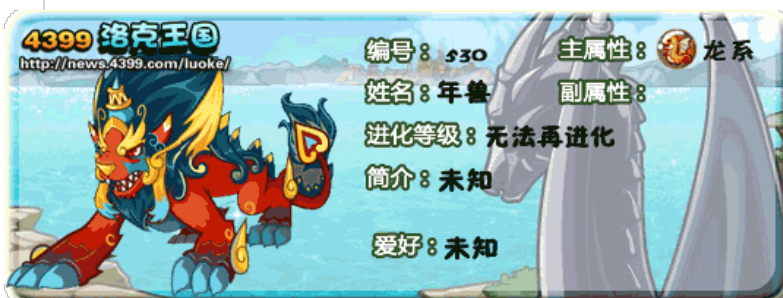
年兽, le monstre Nian, est aujourd'hui un personnage de jeu vidéo.

Désormais, une fois à la veille du Nouvel An, toutes les familles collent des papiers rouges parallèles à la porte, tirent des pétards, allument des bougies toute la nuit et