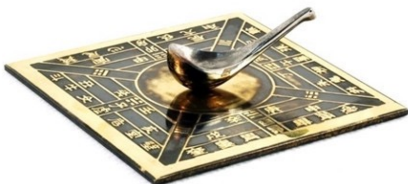
Une ancienne boussole chinoise