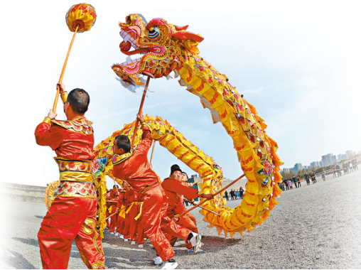
La Danse du Dragon (qui vole après sa perle) marque le réveil de la Nouvelle année.