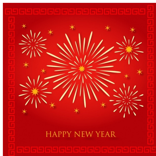
Les feux d'artifice, une invention chinoise